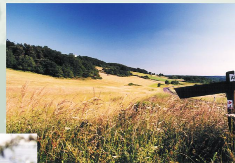
Weg zum Michelsberg