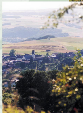
Blick vom Michelsberg

Vom Parkplatz eifelbad führt der Weg zunächst am Erftufer entlang und steigt dann auf zeit- und stellenweise schwer befahrbaren Pfaden steil zum Thönnnesbusch hoch. Hinter Eicherscheid fährt man am Hang bis zum Rückhaltebecken der Erft. Ein langer Anstieg durch das schöne Waldbachtal vorbei an einem alten Steinbruch bringt den Biker nach Mahlberg, wo der Michelsberg mit seinem reizvollen Eifelpanorama lockt. Der Ausblick entschädigt für alle Anstrengungen. Über einen komfortablen Waldweg gelangt man bald zur mitten im Wald gelegenen Kapelle "Decke Tönnnes". Von nun an geht es über den Effelsberger Weg nur noch bergab durch die wunderschönen Eichen- und Buchenbestände des Münster eifeler Stadtwaldes. Ein kurzer Schlenker ins Graubachtal und zurück über die Haarscheid nach Rodert bringt nochmal etwas Futter für den "Höhenmeterfresser". Nach einer kurzen, technisch anspruchsvollen Abfahrt am Radberg, die es mit 15% wirklich in sich hat, kann man locker über 2 km ins Erfttal und zum Startpunkt rollen lassen.