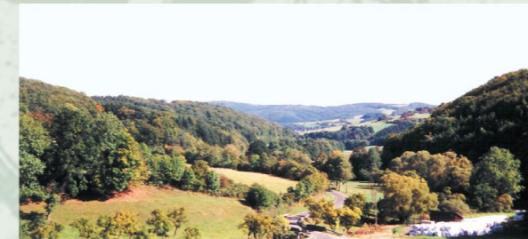
Blick ins obere Erfttal

Begleitet von Mühlen, Burgen, Schlössern und mittelalterlichen Städten fließt die Erft nach ca. 110 km bei Neuss in den Rhein und stellt damit die natürliche und historische Verbindung zwischen der Eifel, der Bördelandschaft und den Ballungszentren in der Kölner Bucht dar.