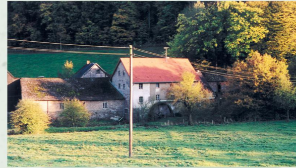
Schocher Mühle bei Holzmühlheim

In Schönau beginnt diese Tour mit ihrem längsten Uphill: Der 4,5 km lange Anstieg und die Höhendifferenz von ca. 220 m hinauf zum Michelsberg kostet so manchen Biker die ersten Schweißperlen. Vom Michelsberg mit seinem phantastischen Rundblick gelangt man vorbei an der Wasserscheide nach Esch, quert die L 165 und rollt in den Schönauer Wald. Nun folgt ein stetiges Auf und Ab auf gut ausgebauten Waldwegen bis man vorbei an der Siedlung Kopnück und nach einem langen Anstieg im Verlauf des Bülgesbach die Landesgrenze bei Vollmert erreicht. Von der L 151 gehts links runter ins Dreisbachtal und über Langscheid nach einem kurzen Singletrail-Downhill in das idyllische obere Erfttal zwischen Schönau und Holzmühlheim. Auf einem komfortablen Talweg folgt man dem Ohbach und hinter einem verlassenen Sägewerk dem Sülchesbach. Nach einem guten Anstieg kann man nach Buir und schließlich wieder zurück ins Erfttal runterrollen. Hier lohnt sich ein kurzer Abstecher zur Erftquelle in Holzmühlheim. Vorbei an 2 Wassermühlen erklimmt man den Giesert von dem sich dem Radler ein toller Blick über die Landschaft eröffnet. Bis zum Ausgangspunkt der Tour in Schönau geht es jetzt nur noch bergab.