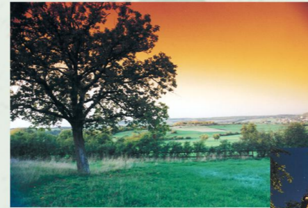
Wiesenlandschaft bei Iversheim

Vom Parkplatz im Schleidtal fährt man in Richtung Stadt, biegt an der Rechtspflegeschule rechts ab, passiert den Sportplatz, quert das Kornbachtal und "beikt" hoch in den Iversheimer Wald. Über einen schönen Weg am Waldrand (Erft-Lieser-Mosel-Weg) mit kurzen Singletrailpassagen und wunderbarem Ausblick auf die hügelige Wiesenlandschaft der Antweiler Senke gelangt man bequem zur K 47, die direkt zur Steinbachtalsperre führt. Hier kann man sich mit einem kühlen Getränk im Biergarten oder einem Besuch im Freibad erfrischen oder sich einfach nur im romantischen Ambiente des Waldsees entspannen. Über die K 47 fährt man wieder zurück und erreicht nach einem langen aber harmlosen Anstieg (3,5 km/120 hm) den Arloffter Berg. Über gut ausgebaute Wege radelt man durch einen fast unendlich scheinenden schattigen Wald. Vorbei an einigen Schutzhütten geht's immer leicht bergab ins Kornbachtal und von dort schon bald über die bekannte Wegstrecke wieder zum Startpunkt zurück.