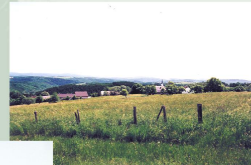
Blick auf Honerath