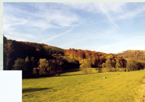
Herbststimmung im Liersbachtal