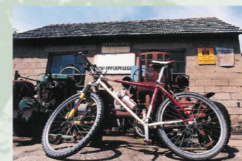
Wer rastet der rostet ...

In Rupperath werden noch heute an riesigen alten Webstühlen Messgewänder hergestellt. Besucheranmeldung unter der Telefon-Nr.: 02253/7111