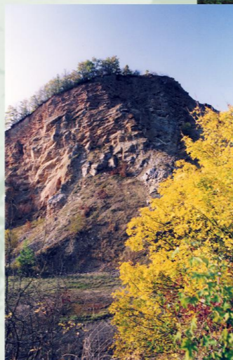
Steinbruch Eschweiler Tal

Vom Parkplatz im Schleidtal aus, radelt man auf einem Waldweg, parallel zur Landstraße (L 234), durch das Schleidtal. Nach einem etwas längeren aber leichten Anstieg, und einer kurzen Singletrail-Passage erreicht man die kleine Kapelle "Decke Tönnes". Von hier aus führt die Tour über das schöne Bodenbachtal, an mehreren Teichen vorbei, wieder hinunter in das Erfttal. Hinter Eicherscheid geht es am Rotesbach entlang durch den Thönneschbusch leicht bergauf zum Nöthener Berg. Nach einer langen Abfahrt gelangt man ins Eschweiler Tal, das man sehr locker durchrollen und dabei die Schönheit dieses Naturschutzgebietes genießen kann. Nach dem Verlassen des Tals und der Überquerung der B 51 führt eine kurze Waldstrecke zurück zum Start.